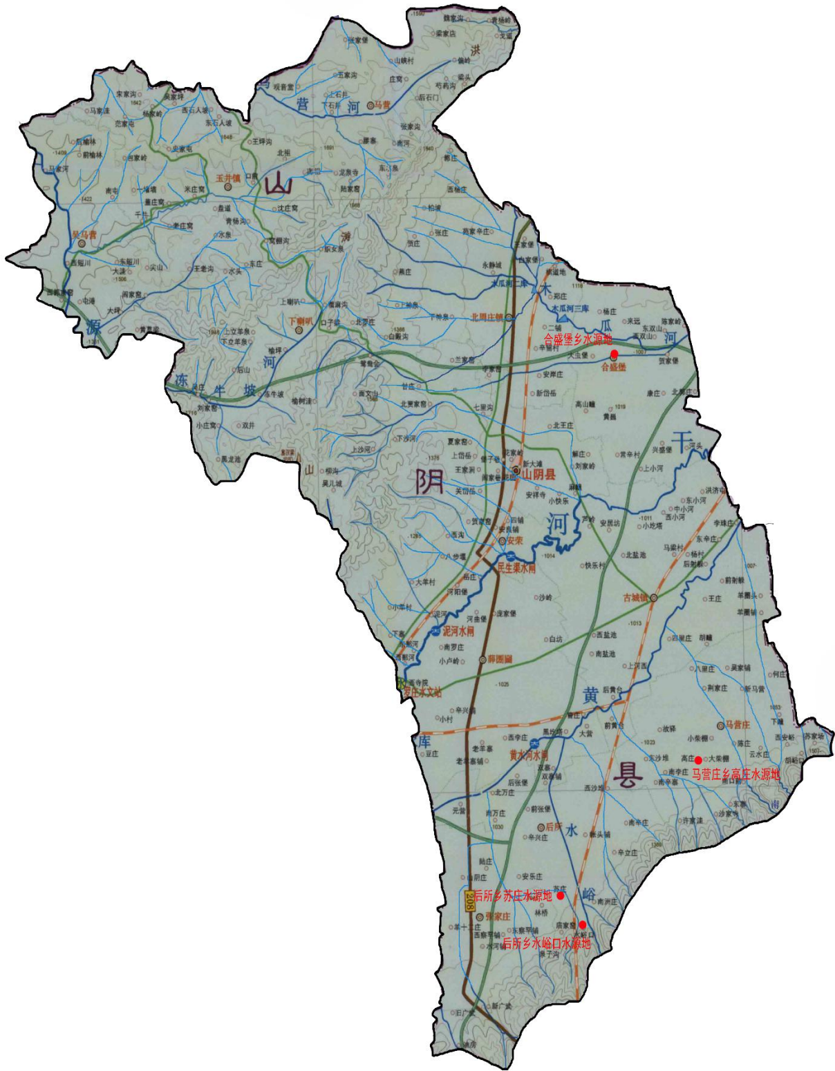
山阴县饮用水水源地分布图